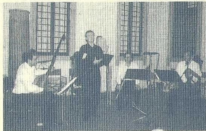
Ensemble Musica Ricercata